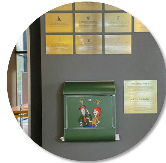
Wall Of Green: Briefkasten für neue Ideen (coming soon - im Aktionsplan!)