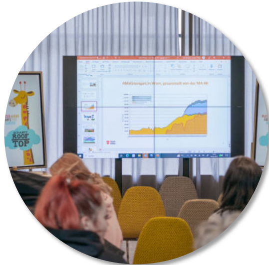
Schulungen für Mitarbeitende