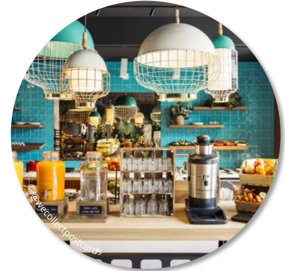
Verzicht auf Einwegverpackungen