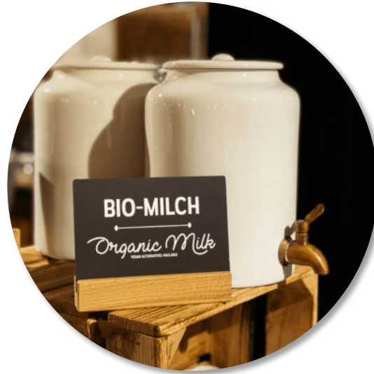
Produkte in Bio- und Fairtrade Qualität