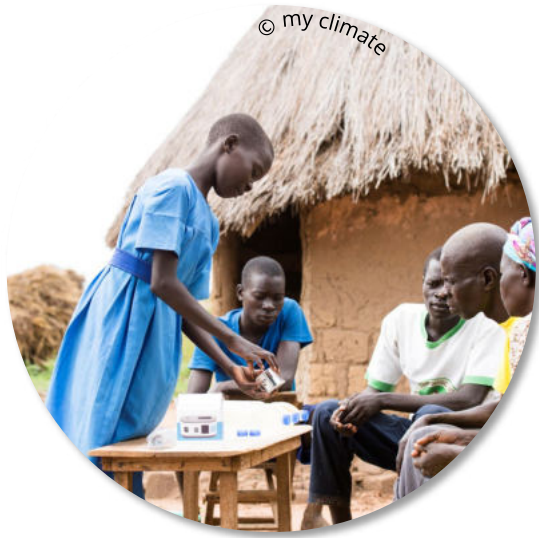
Unterstützung von Sozialprojekten mit 1 Euro pro nicht-getätigte Zimmerreinigung